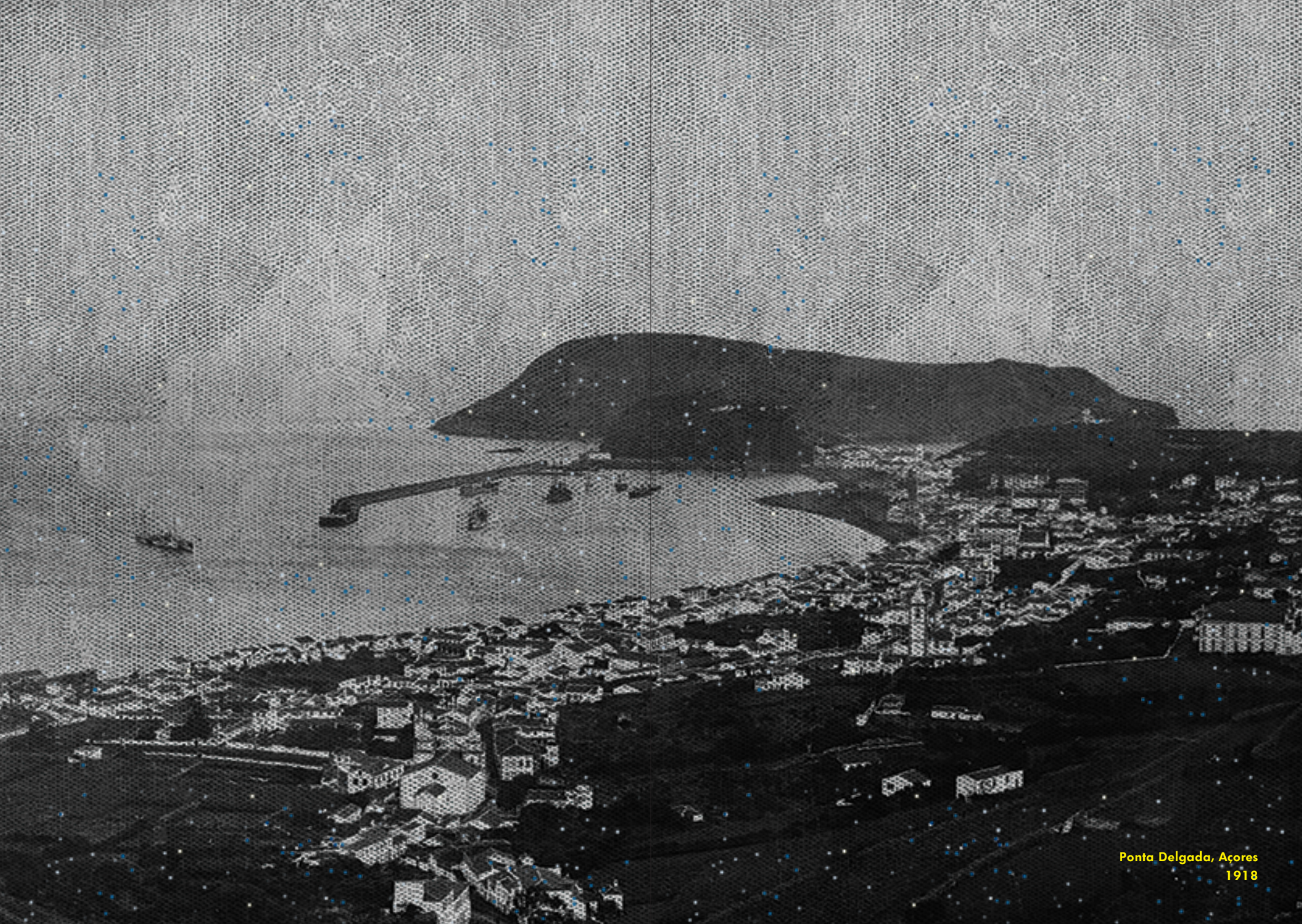
Ponta Delgada, Açores 1918